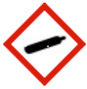
Cylindre de gaz